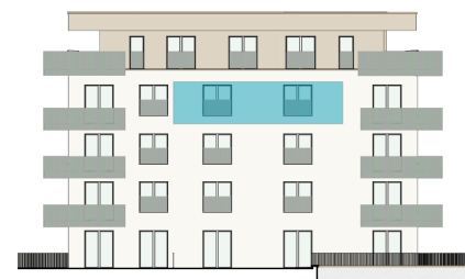
pohled od jihozápadu