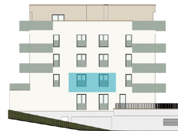
pohled od severozápadu