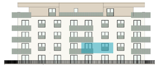
pohled od jihovýchodu